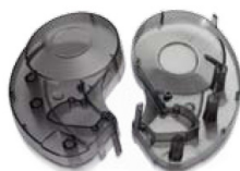
Átlátszó termék Polikarbonátból