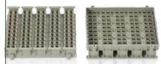
PC/ABS alkatrész számtalan lyukkal és bonyolult felületekkel