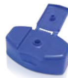
PP zárható fedél