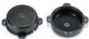
Termék ABS-ből 160 lyukkal